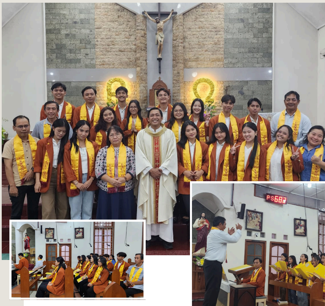
Pelayanan Koor di Paroki Wilibrordus, Cepu - UKWMS Kampus Kota Madiun.