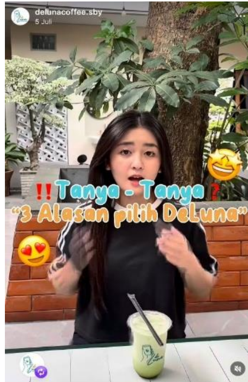
Gambar I. 3 Contoh Content Penulis