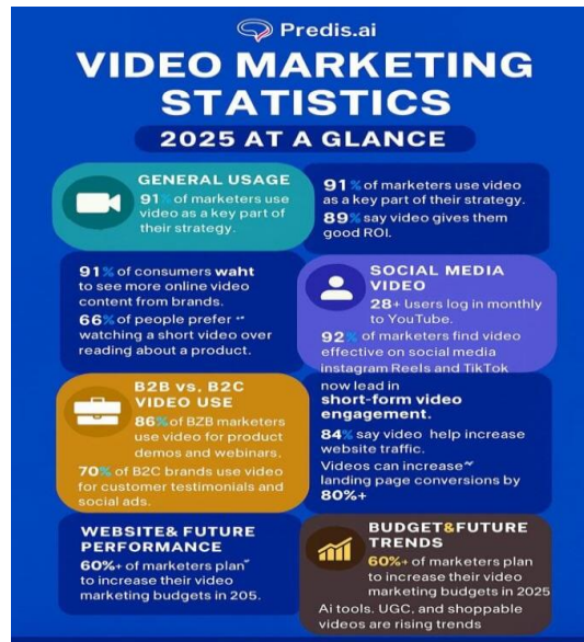
Gambar I. 1 Statistik Marketing

dapat membuktikan bahwa pembuatan konten video merupakan pemasaran digital yang efektif.