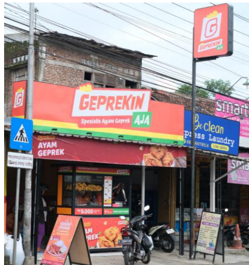
Gambar 1. 3 Outlet Geprekin Aja