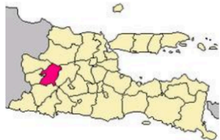
Gambar 2: Tempat tinggal Tulus Setiyadi

Berdasarkan peta tersebut, wilayah tempat tinggal Tulus Setiyadi berada di Jawa Timur sebelah barat. Wilayah ini berbatasan dengan Jawa Tengah, khususnya Kota Solo. Dalam peradaban kuno di Pulau Jawa, khususnya era Mataram kuno, Solo pernah menjadi pusat pemerintahan (Widodo et al. , n.d.). Warisan budaya tersebut masih dipertahankan hingga sekarang dengan keberadaan Keraton Solo. Posisi ini berpengaruh pada lokasi tempat tinggal Tulus yang berbudaya Jawa era Mataraman. Lokasi menentukan cara manusia berbahasa. Tulus Setiyadi dan masyarakat di sekitarnya menggunakan bahasa Jawa khas Mataraman yang dipertahankan hingga sekarang. Salah satu kekhasannya adalah sopan santun yang didasarkan pada stratifikasi sosial dalam masyarakat (Arrini et al. , 2023). Stratifikasi tertinggi menuntut penggunaan bahasa Jawa krama halus. Penutur bahasa Jawa krama halus semakin lama semakin berkurang (Widiana et al. , 2020). Penuturnya tidak banyak dan yang mau mempelajarinya juga sedikit. Meskipun demikian, penggunaan bahasa ini seringkali digunakan dalam acara tradisional seperti perkawinan, khitanan, syukuran, dan bersih desa (Hernandez-Barraza et al. , 2019). Posisi yang langka inilah yang diambil oleh Tulus dalam masyarakat. Kemampuan Tulus dalam berbahasa Jawa krama halus membuatnya dilibatkan dalam berbagai kegiatan